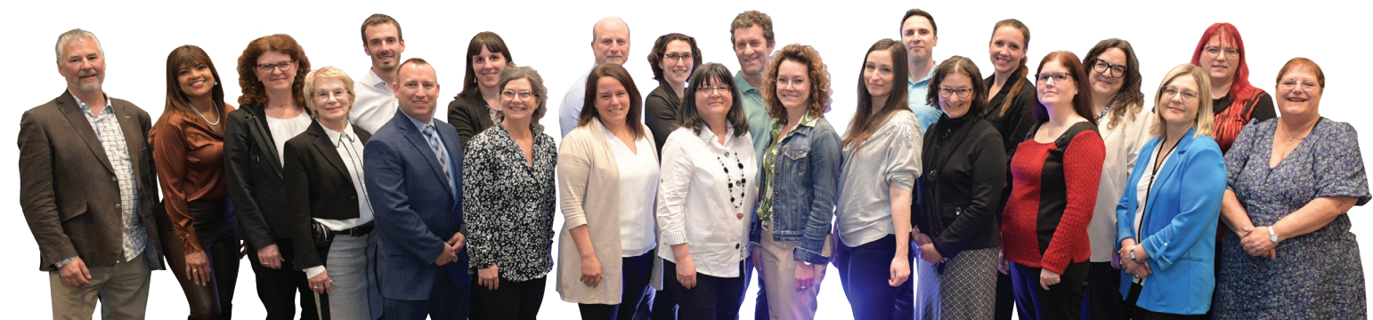
Les membres de l'équipe de MultiPrévention.